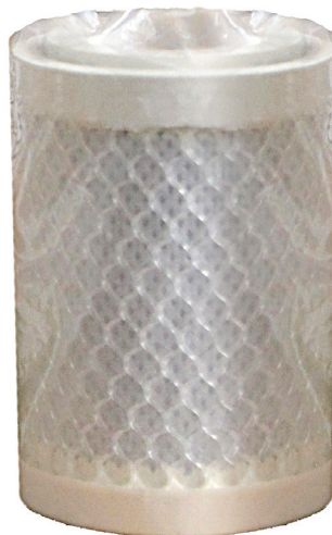
6066-5E オイルミスト カーボンフィルター