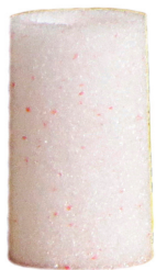
6066-21E 5 MICRON ELEMENT