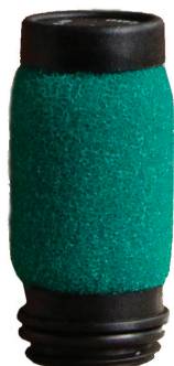
6066-22E 0.1 MICRON ELEMENT