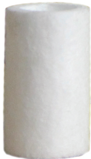
6066-3E DX カートリッジ