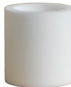
6065-01 REPLACEMENT FILTER