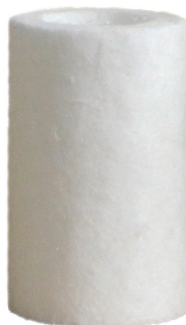
6066-4E BX カートリッジ