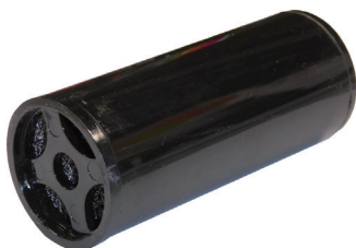
スタック型フィルターアセンブリ用 フィルターカートリッジ(2019年後半 以降モデル)