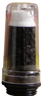
6066-23E オイルミスト カートリッジ