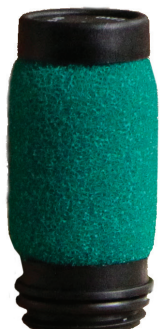
6066-22E 0.1ミクロン フィルターエ レメント