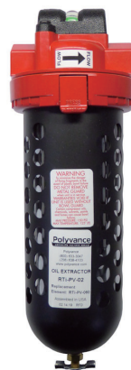
フィルターアセンブリー (2019年後半以降モデル)